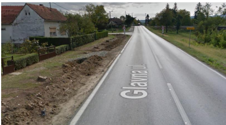
Vertikalna krivina prije početka zahvata (sjeverozapad)

Međutim, vertikalna krivina neposredno prije početka područja zahvata (sjeverozapad) i horizontalna krivina nakon područja zahvata (jugoistok) uzrokuju smanjenu preglednost na samom kolniku na području zahvata – što dodatno predstavlja opasnost za pješake koji se svakodnevno kreću kolnikom.