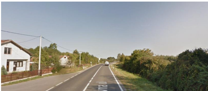
Horizontalna krivina nakon područja zahvata (jugoistok)